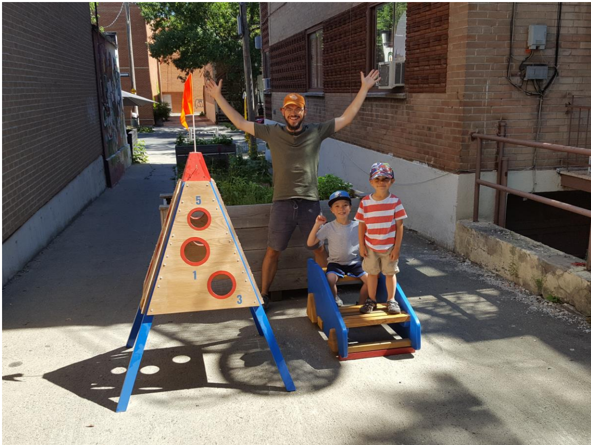
Mobiliers verts et actifs installés dans la ruelle verte "La Cour arrière" dans le quadrilatère St-Zotique / Bélanger / Fabre / Garnier dans Rosemont–La Petite-Patrie, Montréal.

À l'échelle du quartier, les enfants et les familles peuvent compter sur différents lieux et infrastructures pour pratiquer des activités physiques. Les ruelles en font partie et sont des terrains privilégiés pour le jeu libre.